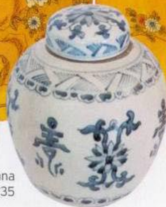
Pote de porcelana chinesa, na Artica, €35