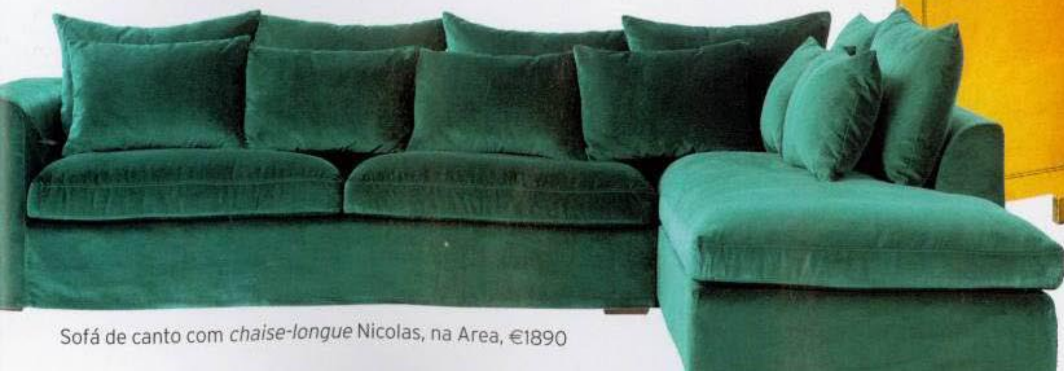
Sofá de canto com chaise-longue Nicolas, na Area, €1890