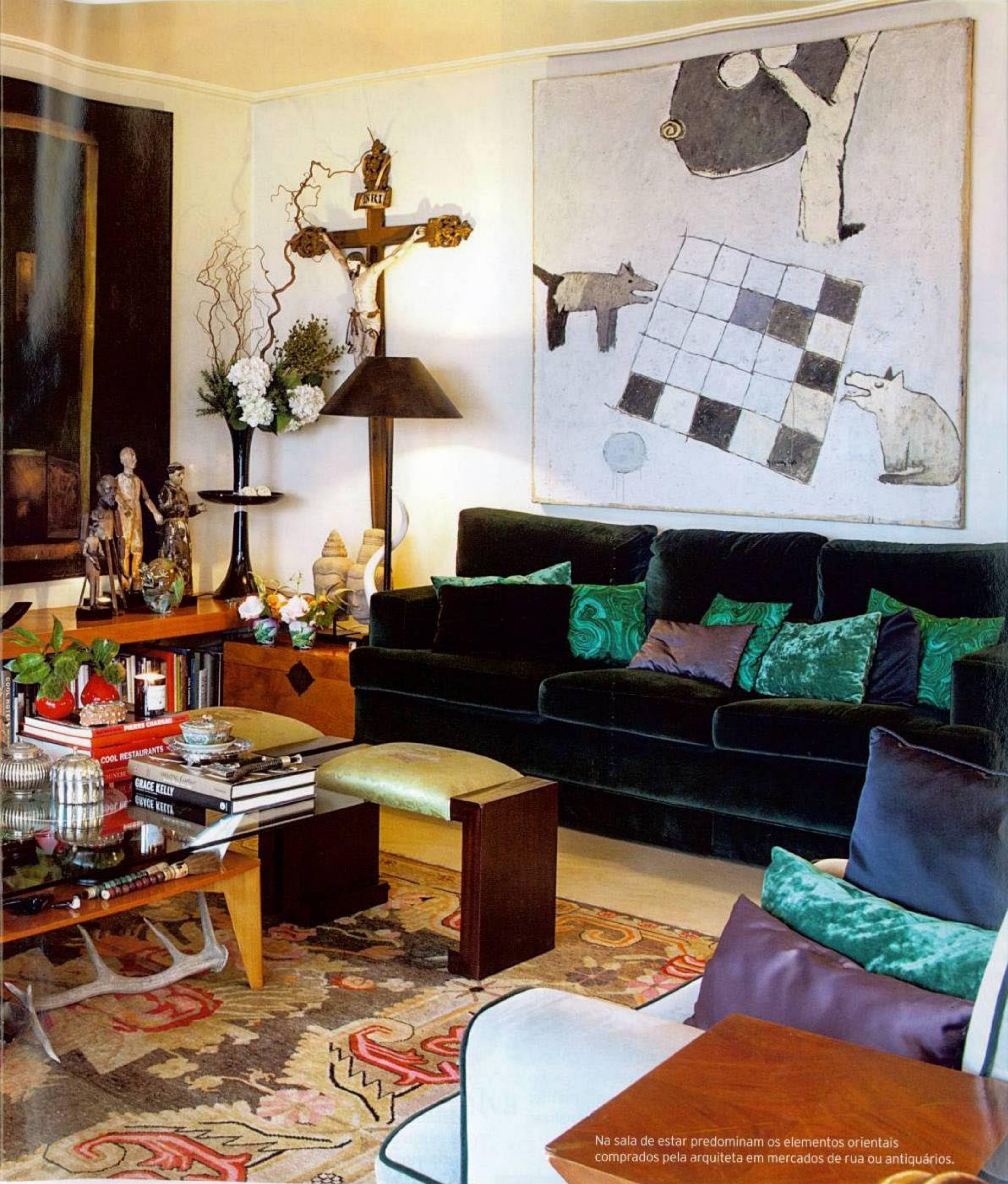
Na sala de estar predominam os elementos orientais comprados pela arquiteta em mercados de rua ou antiquários.