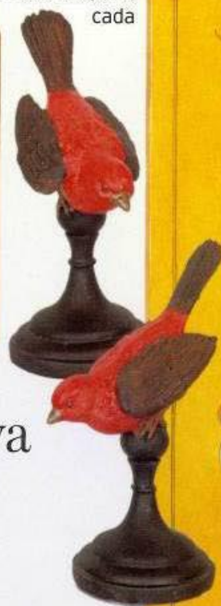
Pássaros com base de madeira, na Artica, €10 cada