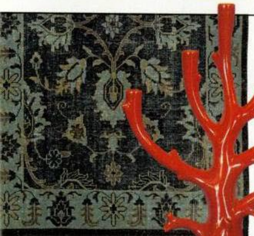
Tapete Patina, na BoConcept, a partir de €1295

Livro de cabeceira... "Estou a ler 'Rumo à Liberdade', de Slavomir Rawicz. Adoro também biografias que, normalmente, vou intercalando com o livro do momento. Estou a ler também a vida da Helena Rubinstein."