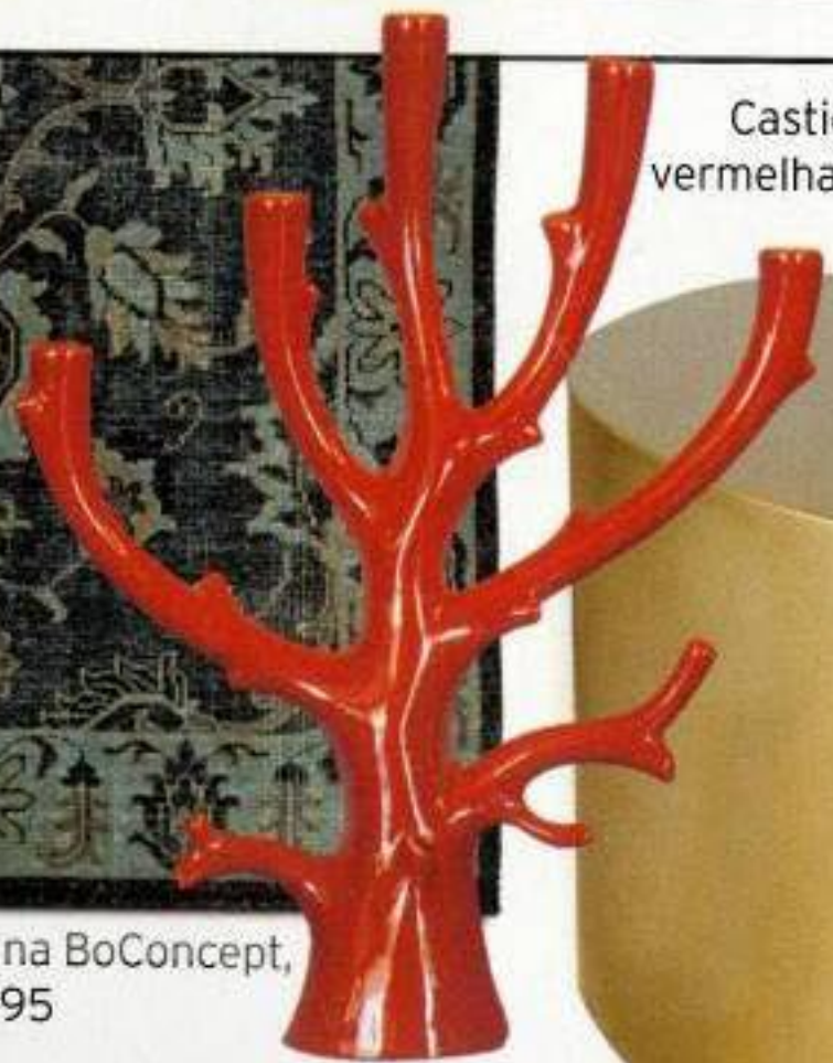
Castiçal de porcelana vermelha, na Artica, €80